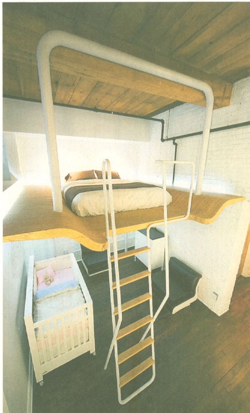
L'aménagement d'une mezzanine dans ce condo de 700 pieds carrés a permis à l'agence Duchesneau & McComber de rafler un Prix d'excellence 2009, de l'Ordre des architectes du Québec.